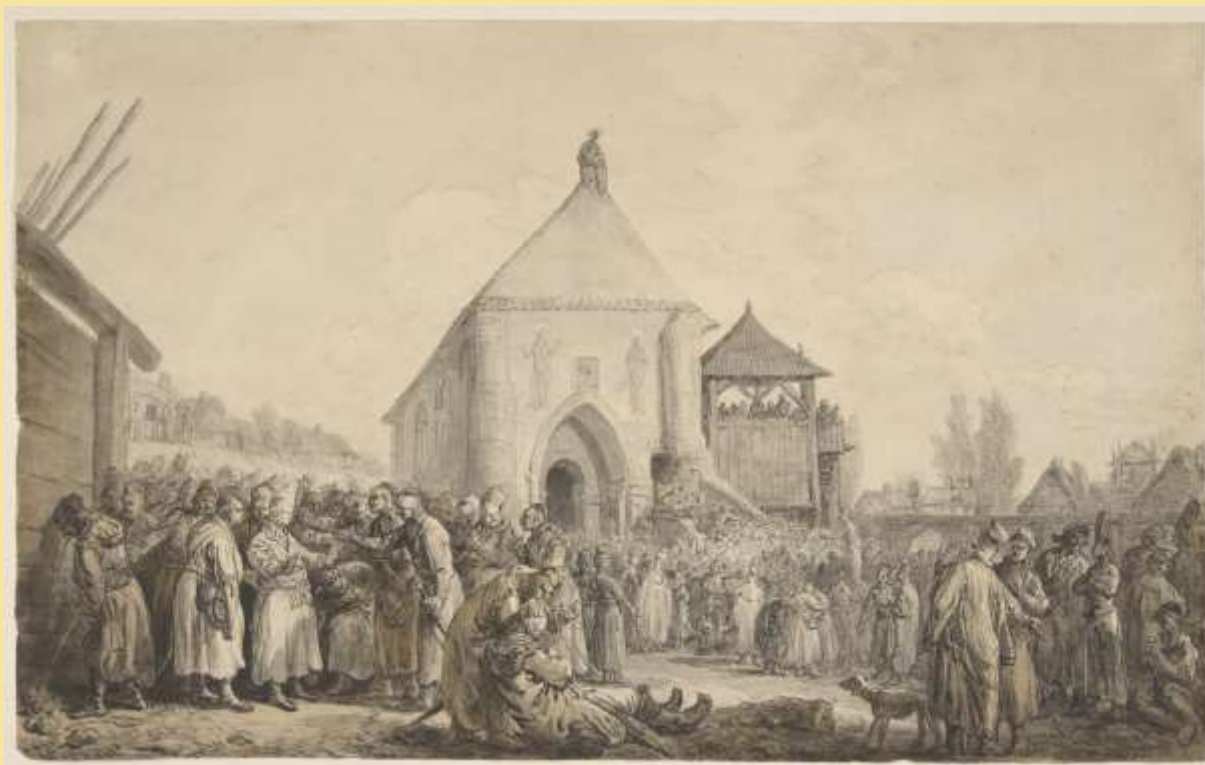
Jan Piotr Norblin, Sejmik przed kościołem, 1790, Muzeum Narodowe w Krakowie