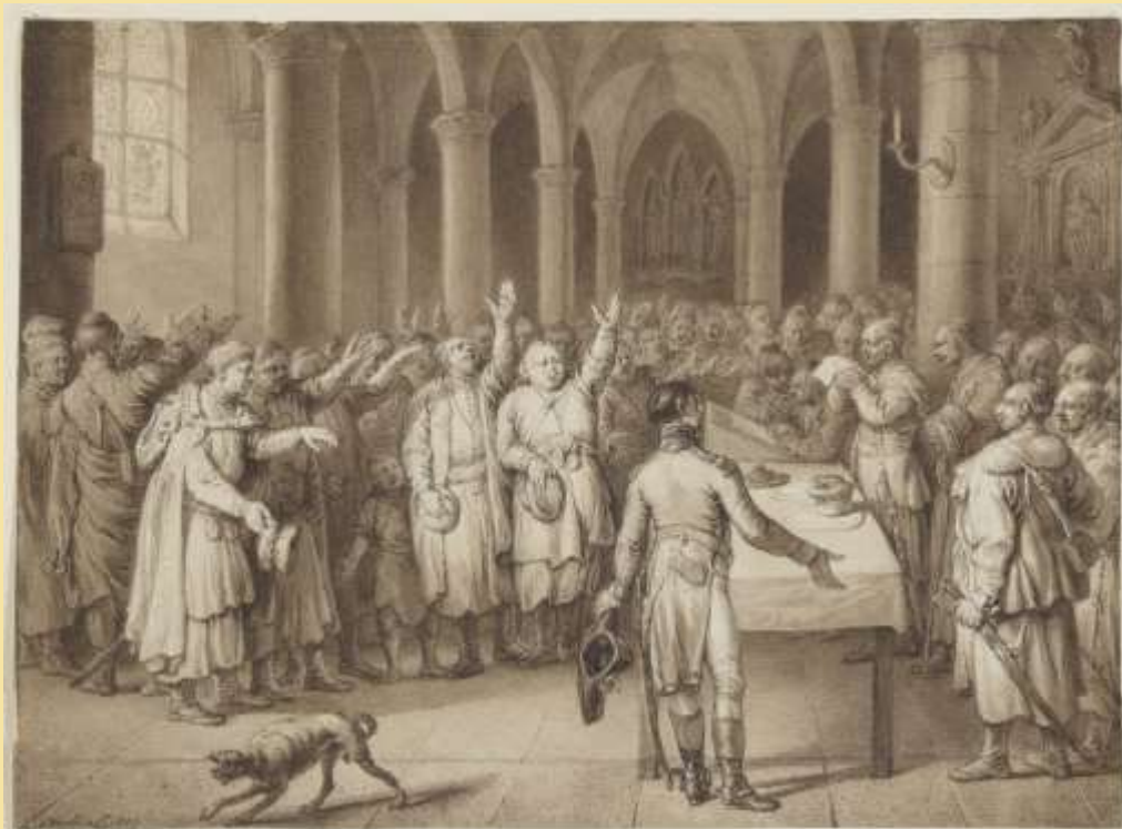
Jan Piotr Norblin, Sejmik w kościele, 1801, Muzeum Narodowe w Krakowie